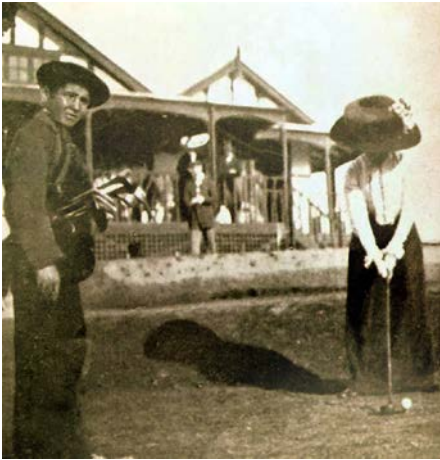
Foto 1. Dama con su caddy en el Madrid Polo Club (principios del siglo XX).